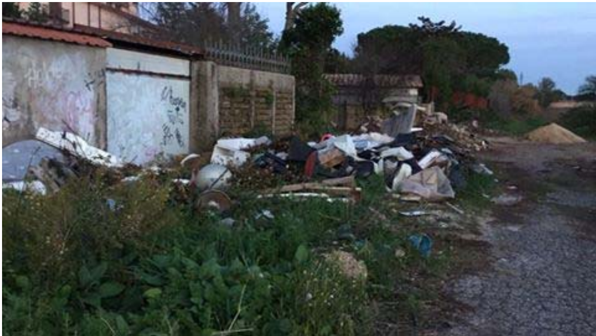
Discarica abusiva area verde linea di confine tra Mostacciano e Casal Brunori