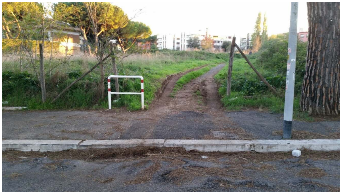
Dissuasore divelto su via Vinicio Cortese, ( Fronte Asilo Comunale Tappeto Volante )