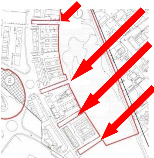
Aree da ripristinare Punto 5