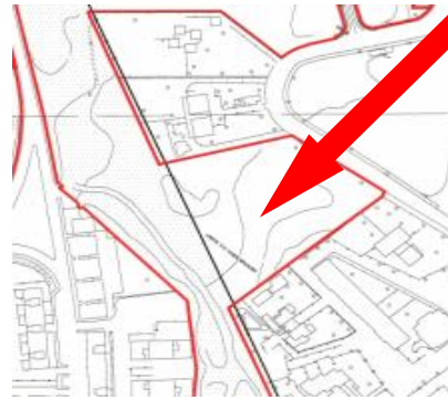
Area da ripristinare Punto 2