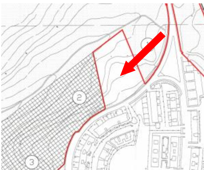
Area da ripristinare Punto 3