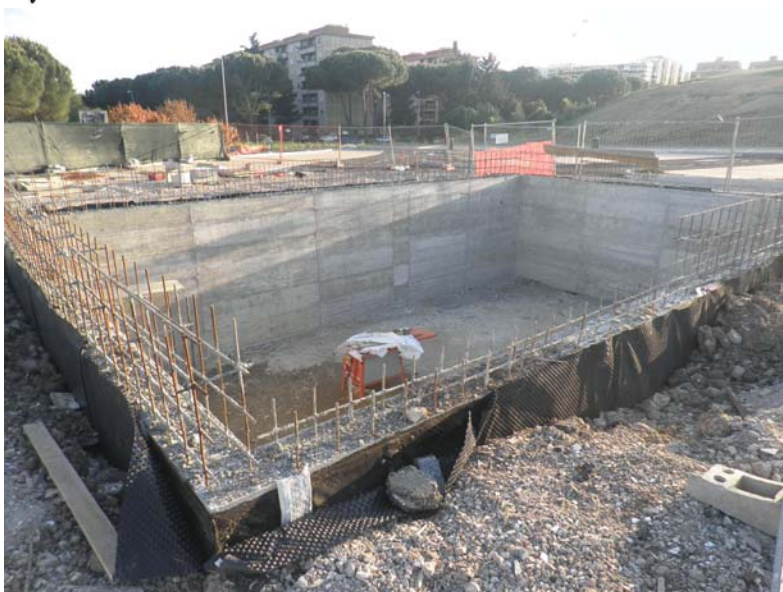
Vasca esistente da destinare alla raccolta delle acque piovane.