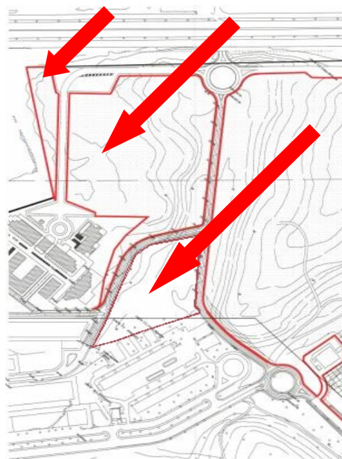
Area da ripristinare Punto 4