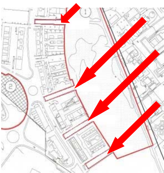
Aree da ripristinare Punto 5