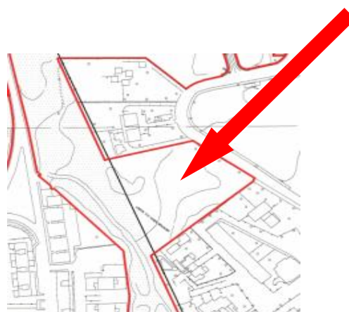
Area da ripristinare Punto 2