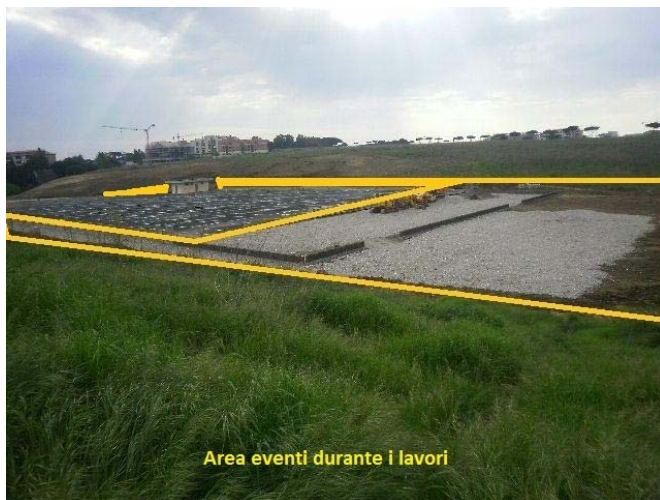
Area eventi durante i lavori