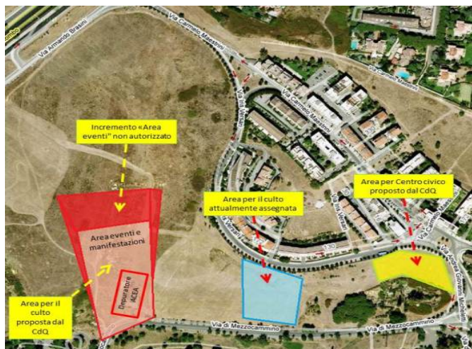
Proposta area del CdQ per Centro Civico più centrale. Proposta area del CdQ per l'opera parrocchiale