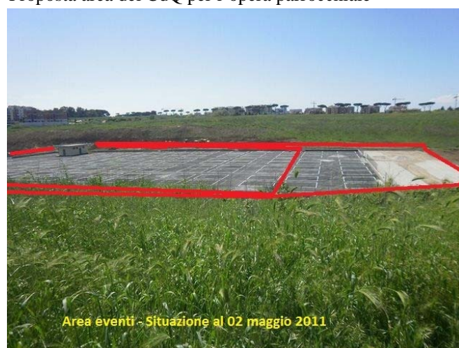
Area eventi - Situazione al 02 maggio 2011