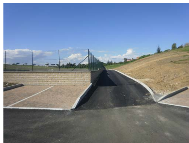
Strada laterale destra difforme dalla D.D. N. 2118

Le strade, per consentire l'accesso al parcheggio aggiunto, e l'incremento dell'Area Eventi sono stati realizzati, successivamente al completamento dei lavori previsti dalla D.D. N. 2118 e in assenza delle autorizzazioni previste dalla legge, come verificato con l'accesso ai documenti amministrativi previsti dalla Legge N. 241/90. Con l'approvazione della variante Quinquies si vorrebbero condonare i lavori attualmente in corso.