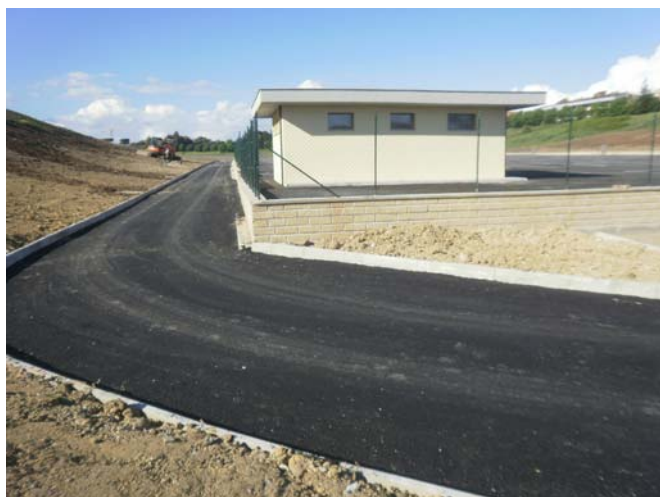
Strada laterale sinistra difforme dalla D.D. N. 2118