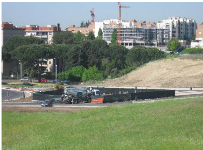
Area Depuratore ACEA – foto al 18 aprile 2011